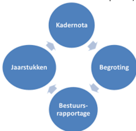
Figuur 4: P&C cyclus Vijfheerenlanden

De gemeente heeft een eigen planning en control cyclus van de jaarstukken, bestuurs-rapportages, kadernota en begroting, de P&C-cyclus (planning en control cyclus). Dit is een zich voortdurend herhalend proces, zie onderstaande figuur 4.