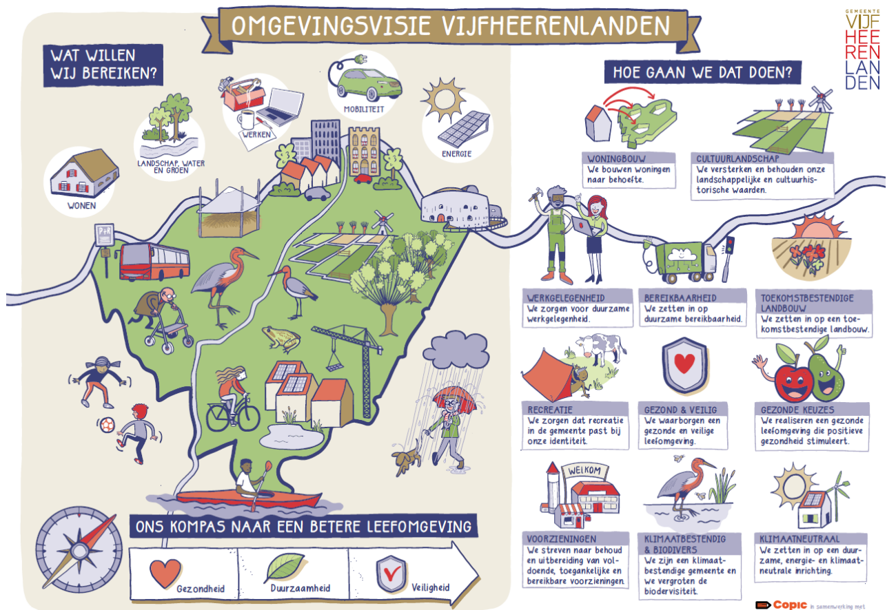
Figuur 1: Schematische weergave opbouw en inhoud omgevingsvisie

De gehele omgevingsvisie staat hier: https://omgevingsvisie.vijfheerenlanden.nl/