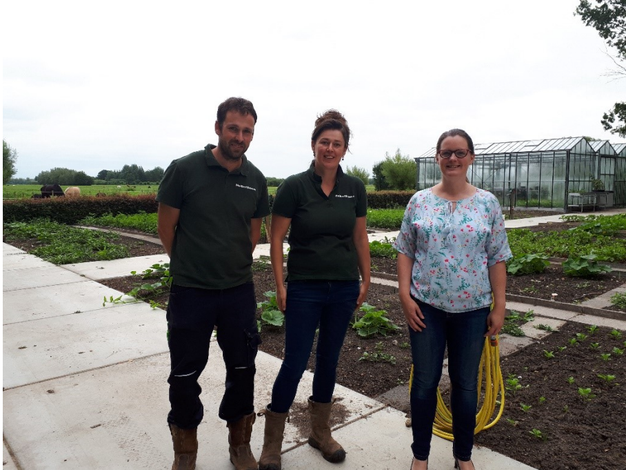
Educatie op zorgboerderij Huiberthoeve

gesprek met de samenwerkingsverbanden aangaan. Tevens wordt contact gelegd met ZonMW voor kennisverbreding.