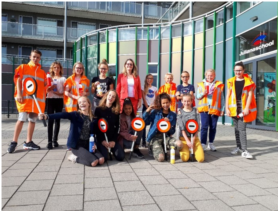
Deze kinderen dragen al een steentje bij

Gemeenten en samenwerkingsverbanden passend onderwijs hebben vanuit respectievelijk de Jeugdwet en de Wet passend onderwijs hun eigen, maar ook gedeelde verantwoordelijkheid voor kinderen. De Jeugdwet en de Wet passend onderwijs zijn opgesteld als zogenaemde spiegelwetten. Dit betekent dat er een gezamenlijke achterliggende gedachte is, namelijk effectiever, sneller en preventiever hulp bieden. De gedeelde verantwoordelijkheid zit in samenwerking op het gebied van preventie en signalering, maar ook in de afstemming van actie in de uitvoering. Het gaat dan onder andere om het maken van duidelijke onderlinge afspraken voor de inzet van jeugdhulp bij onderwijszorgarrangementen, in of om de klas.