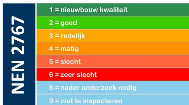
Figuur 1 NEN 2767 conditiescore

Elke organisatie hanteert, afhankelijk van de grootte van het areaal en de beschikbare financiële middelen, een kwaliteitsniveau. Voor kunstwerken bestaat geen specifieke schaal, daarom wordt de NEN 2767 gebruikt. NEN 2767 is dé norm voor conditiemeting. NEN 2767 is het instrument voor het objectief en uniform meten van de fysieke kwaliteit van bouw- en installatiedelen van gebouwen en/of infrastructuur. Vanuit deze meting volgen conditiescores en niveaus waardoor snel inzichtelijk wordt wat de staat van onderhoud van een kunstwerk is. Voor civiele kunstwerken hanteren we conditieniveau 3 en hoger. Dit betekent dat we onze objecten op dit niveau willen houden en wanneer het zakt naar conditieniveau 4, hier de passende maatregelen treffen om deze weer naar niveau 3 of hoger te brengen.